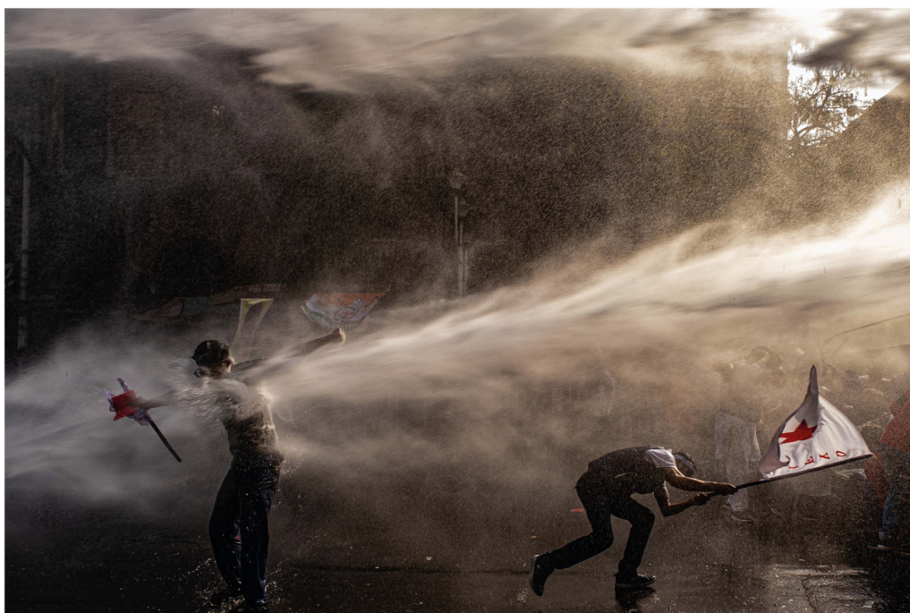
WWDPHC 2024 Overall Winner | Dipayan Bose

Scadenza 28/02/2025 Iscrizioni su worldwaterday.it/en